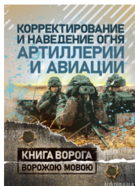
Коректування і наведення вогню артилерії і авіації. Книга ворога, ворожою мовою