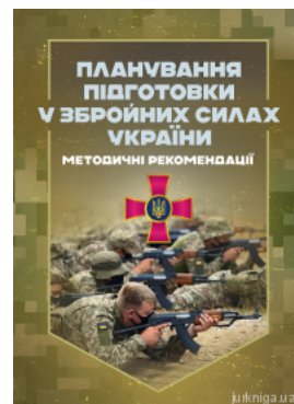
Планування підготовки у Збройних Силах України