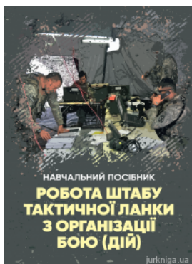
Робота штабу тактичної ланки з організації бою (дій)