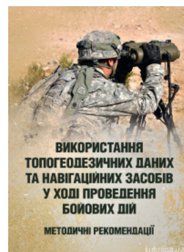
Використання топогеодезичних даних та навігаційних засобів у ході проведення бойових дій