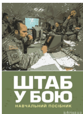
Штаб у бою