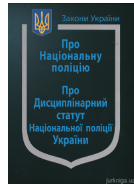
Закон України "Про Національну поліцію", "Про дисциплінарний статут Національної поліції України"