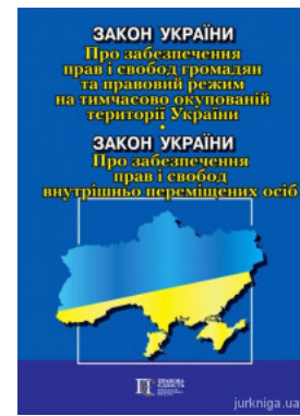
Закон України "Про забезпечення прав і свобод громадян та правовий режим на тимчасово окупованій території України". Закон України...

Перейти до галузі права Юридичний менеджмент