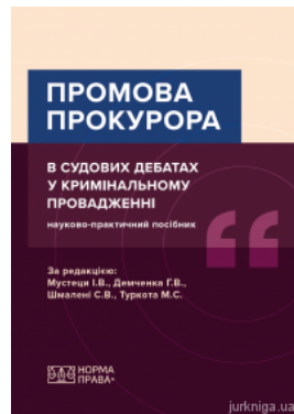
Промова прокурора в судових дебатах у кримінальному провадженні