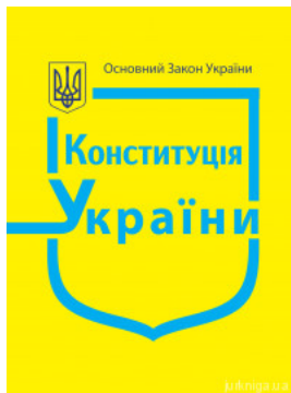
Конституція України. Міні