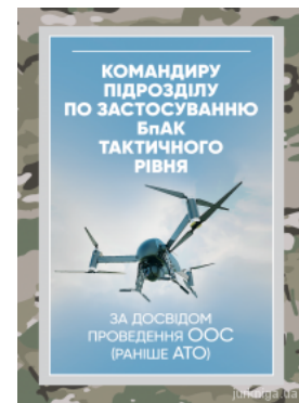
Командиру підрозділу по застосуванню БпАК тактичного рівня (за досвідом проведення ООС (раніше АТО))