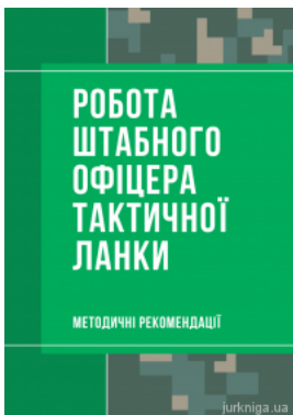
Робота штабного офіцера тактичної ланки