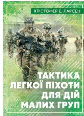
Тактика легкої піхоти для дій малих груп