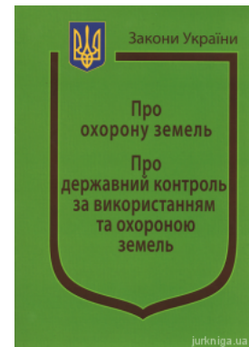
Закони України "Про охорону земель", "Про державний контроль за використанням та охороною земель"