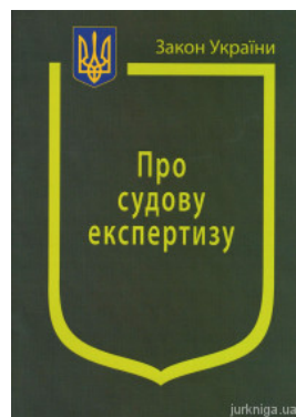
Закони України "Про судову експертизу"