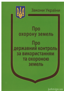
Закони України "Про охорону земель", "Про державний контроль за використанням та охороною земель"