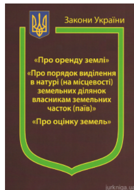
Закони України "Про оренду землі", "Про порядок виділення в натурі (на місцевості) земельних ділянок власникам земельних часток (паїв)", "Про...