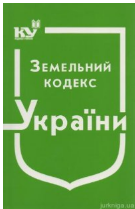
Земельний кодекс України