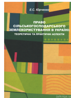
Право сільськогосподарського землекористування в Україні: теоретичні та практичні аспекти