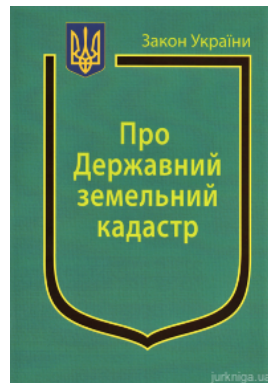
Закон України "Про Державний земельний кадастр"