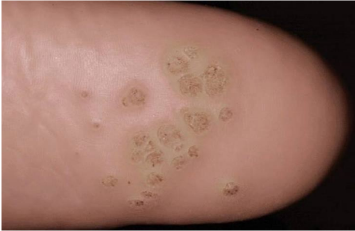
Рис.3. Бородавки на ділянці шкіри п'яток