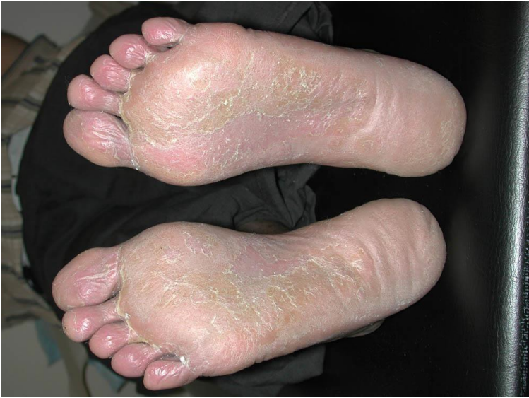
Рис.1. Підшви при мікозі стоп