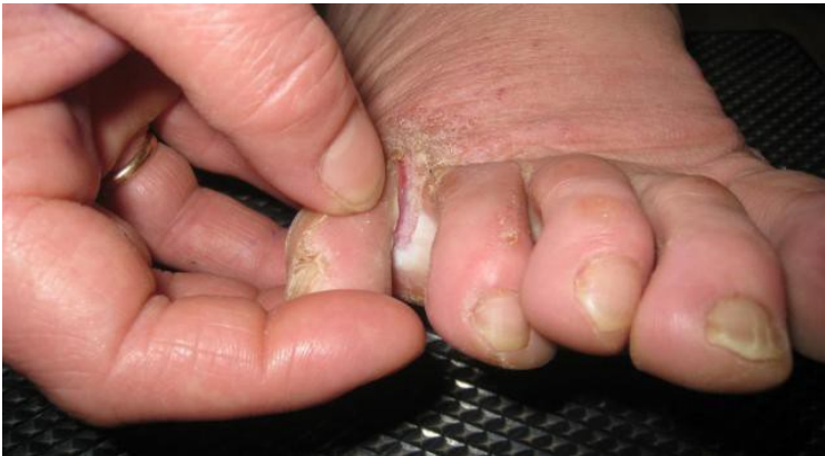
Рис.2. Мікоз стоп. Міжпальцева локалізація