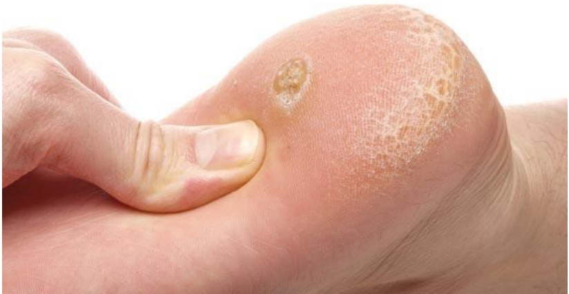
Рис.4. Бородавки на підошвах: типова локалізація ( https://www.performpodiatry.co.nz/warts-and-verruca/ )