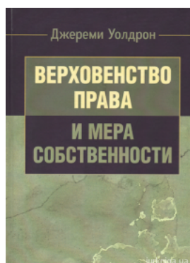
Верховенство права и мера собственности