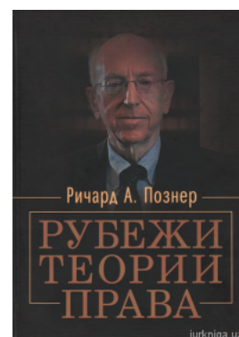
Рубежи теорії права