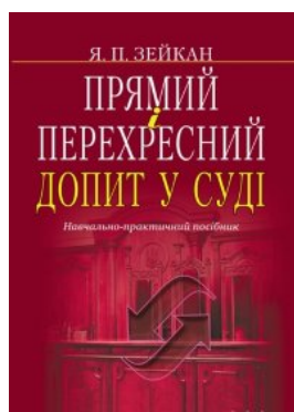
Прямий і перехресний допит у суді