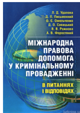
Міжнародна правова допомога у кримінальному провадженні в питаннях та відповідях