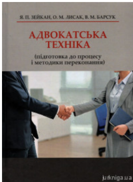
Адвокатська техніка (підготовка до процесу і методики переконання)