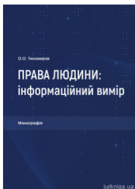
Права людини: інформаційний вимір