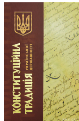
Конституційна традиція української державності