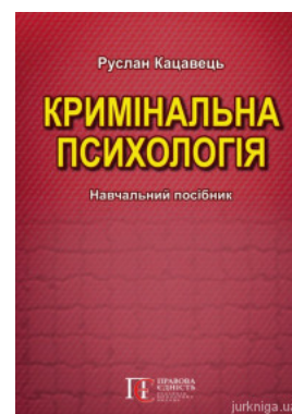
Кримінальна психологія. Навчальний посібник

Перейти до галузі права Конституційне право