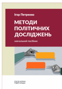
Методи політичних досліджень