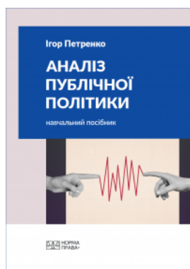
Аналіз публічної політики