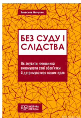
Без суду і слідства