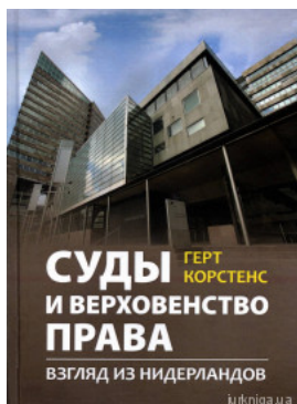
Суды и верховенство права: взгляд из Нидерландов