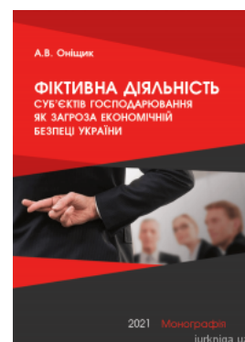
Фіктивна діяльність суб'єктів господарювання як загроза економічній безпеці України

Перейти до галузі права Конституційне право