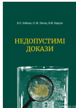
Недопустимі докази. Видання друге