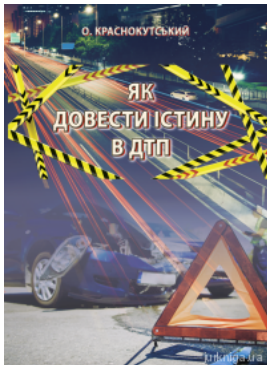
Як довести істину в ДТП