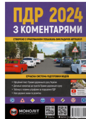
ПДР України 2024 з коментарями