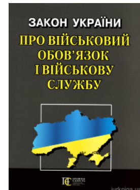
Закон України "Про військовий обов'язок і військову службу". Алерта