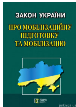
Закон України "Про мобілізаційну підготовку та мобілізацію". Алерта