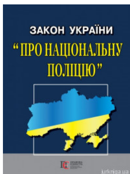
Закон України "Про національну поліцію". Алерта