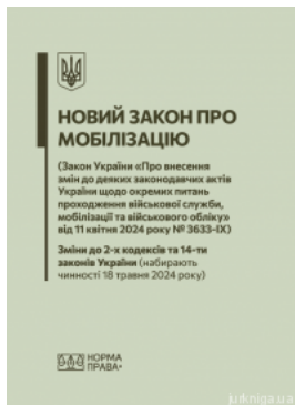
Новий закон про мобілізацію