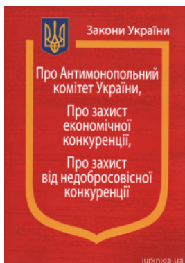
Закони України: "Про Антимонопольний комітет України", "Про захист економічної конкуренції"