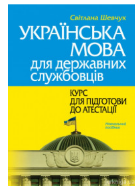
Українська мова для державних службовців: курс для підготовки до атестації