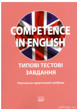
Competence in English. Типові тестові завдання