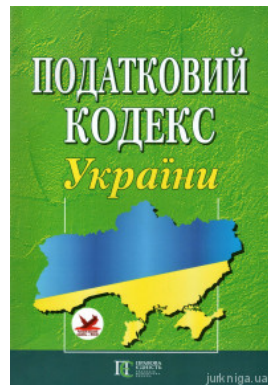
Податковий кодекс України. Алерта