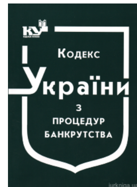
Кодекс України з процедур банкрутства

Перейти до галузі права Господарське право та процес