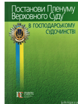
Постанови Пленуму Верховного Суду в господарському судочинстві