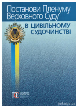
Постанови Пленуму Верховного Суду в цивільному судочинстві