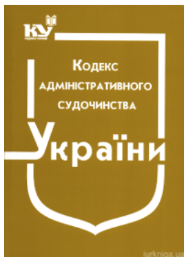
Кодекс адміністративного судочинства України