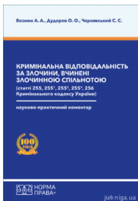
Кримінальна відповідальність за злочини, вчинені злочинною спільнотою (статті 255, 255-1, 255-2, 255-3, 256 Кримінального кодексу України)....