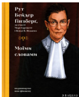
Моїми словами: біографія