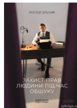
Захист прав людини під час обшуку

Перейти до галузі права Кримінальне право та процес