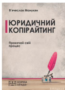
Юридичний копірайтинг. Прокачай свій процес