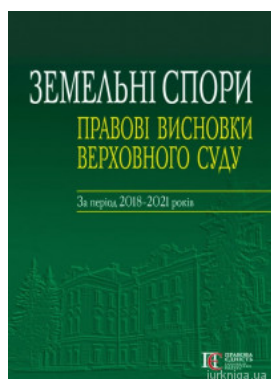
Земельні спори: правові висновки Верховного Суду за період 2018-2021 років