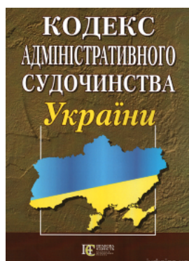
Кодекс адміністративного судочинства України. Алерта