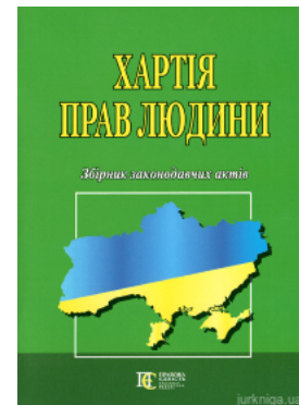
Хартія прав людини. Збірник законодавчих актів. Алерта