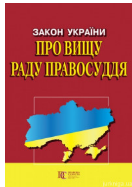
Закон України "Про вищу раду правосуддя". Алерта