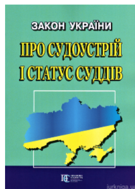
Закон України "Про судоустрій і статус суддів". Алерта