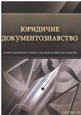
Юридичне документознавство. Навчальний посібник для підготовки до іспитів