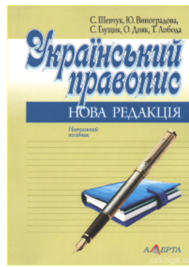
Український правопис: нова редакція. Навчальний посібник