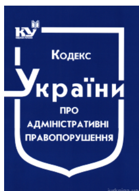
Кодекс України про адміністративні правопорушення