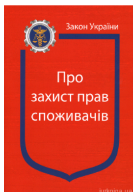
Закон України "Про захист прав споживачів"