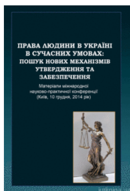
Права людини в Україні в сучасних умовах: пошук нових механізмів утвердження та забезпечення