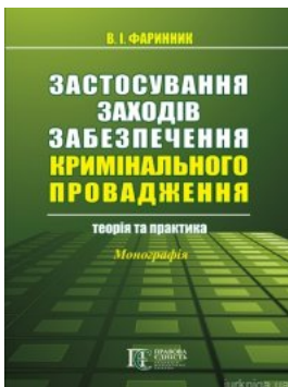
Застосування заходів забезпечення кримінального провадження: теорія та практика