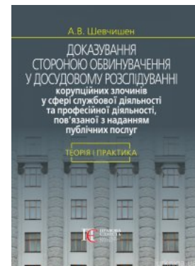
Доказування стороною обвинувачення у досудовому розслідуванні корупційних злочинів у сфері службової діяльності та професійної діяльності,...

Перейти до галузі права Кримінальне право та процес