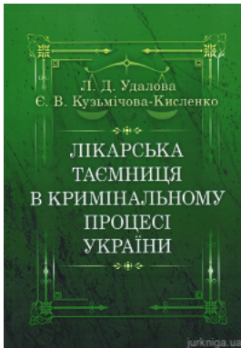
Лікарська таємниця в кримінальному процесі України