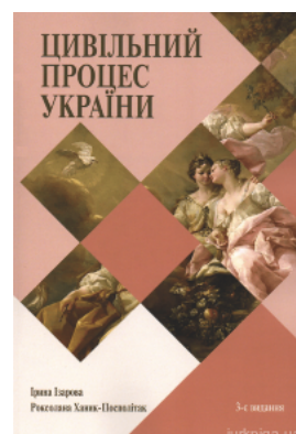
Цивільний процес України. Навчальний посібник для студентів юридичних спеціальностей закладів вищої освіти