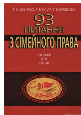
93 питання з сімейного права. Посібник для суддів