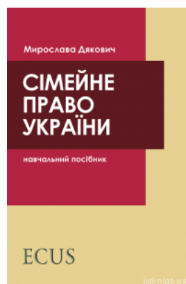
Сімейне право України. Навчальний посібник