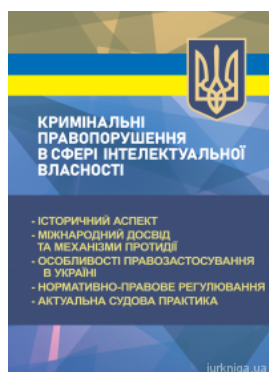
Кримінальні правопорушення в сфері інтелектуальної власності