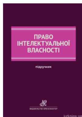
Право інтелектуальної власності: підручник