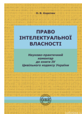
Цивільний кодекс України. Книга IV. Право інтелектуальної власності