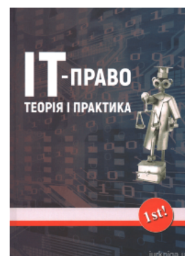
ІТ-право: теорія та практика

Перейти до галузі права Інтелектуальна власність