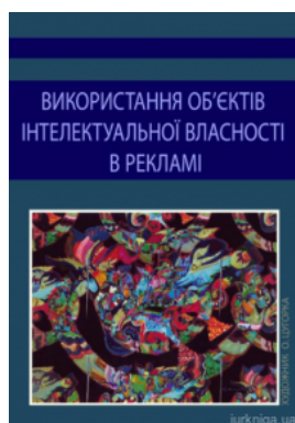
Використання об'єктів інтелектуальної власності в рекламі