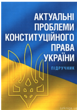
Актуальні проблеми конституційного права України. Підручник затверджений МОНУ