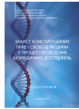
Захист конституційних прав і свобод людини у процесі проведення біомедичних досліджень