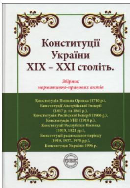
Конституції України XIX – XXI століть: збірник нормативно-правових актів