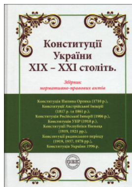
Конституції України XIX – XXI століть: збірник нормативно-правових актів