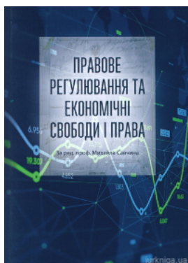
Правове регулювання та економічні свободи і права