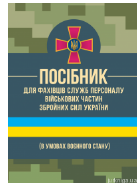
Посібник для фахівців служб персоналу військових частин Збройних Сил України (в умовах воєнного стану)