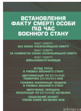
Встановлення факту смерті особи під час воєнного стану