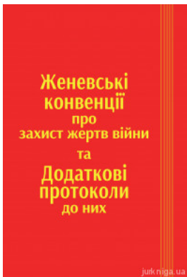
Женевські конвенції про захист жертв війни та додаткові протоколи до них