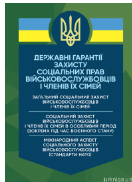
Державні гарантії захисту соціальних прав військовослужбовців і членів їх сімей