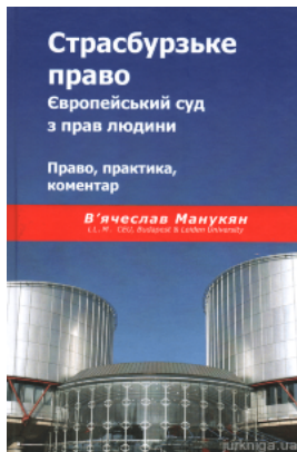
Страсбурзьке право. Європейський суд з прав людини. Право, практика, коментар