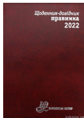
Щоденник-довідник правника 2022