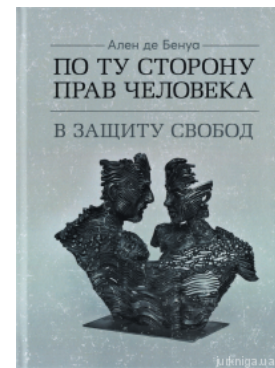
По ту сторону прав человека. В защиту свобод

Перейти до галузі права Адміністративне право