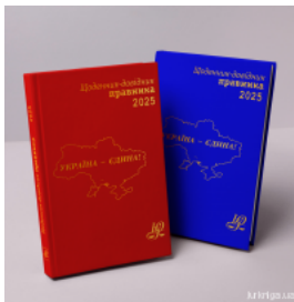
Щоденник-довідник правника 2025