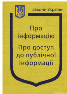
Закони України "Про інформацію", "Про доступ до публічної інформації"