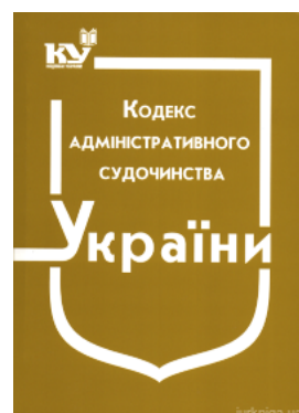
Кодекс адміністративного судочинства України