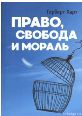
Право, свобода и мораль