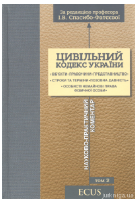
Цивільний кодекс України. Науково-практичний коментар. Том 2. Об'єкти. Правочини. Представництво. Строки та терміни. Позовна давність. Особисті...