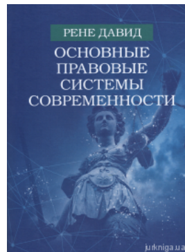
Основные правовые системы современности