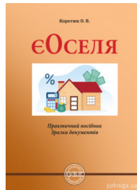
€Оселя. Практичний посібник, зразки документів