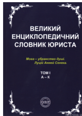
Великий енциклопедичний словник юриста у 3-х томах