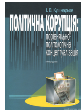
Політична корупція: порівняльно-політологі чна концептуалізація

Перейти до галузі права Філософія та психологія права