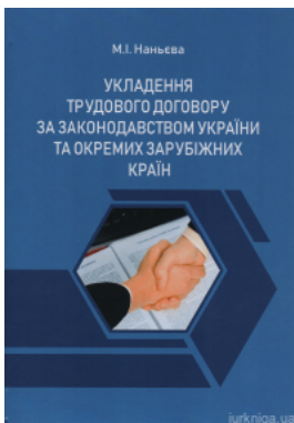
Укладення трудового договору за законодавством України та окремих зарубіжних країн