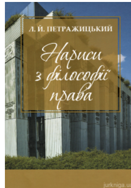
Нариси з філософії права. Л.І. Петражицький