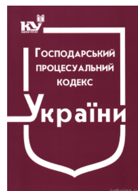
Господарський процесуальний кодекс України