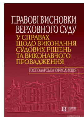
Правові висновки Верховного Суду у справах щодо виконання судових рішень та виконавчого провадження (господарська юрисдикція)

Перейти до галузі права Судебная практика