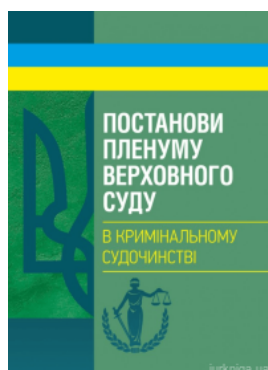
Постанови Пленуму Верховного суду в кримінальному судочинстві