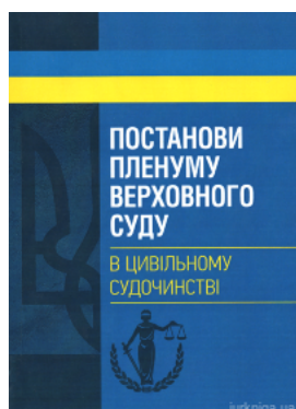
Постанови Пленуму Верховного суду в цивільному судочинстві