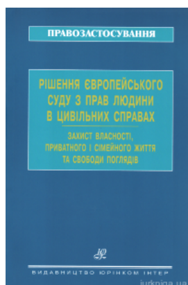
Рішення Європейського суду з прав людини в цивільних справах. Захист власності, приватного і сімейного життя та свободи поглядів