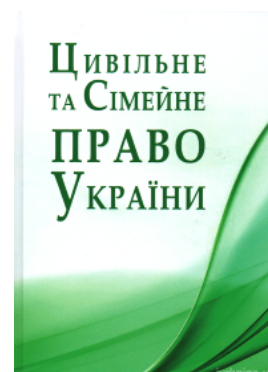
Цивільне та сімейне право України. Навчальний посібник

Перейти до галузі права Теорія держави і права