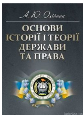
Основи історії і теорії держави та права