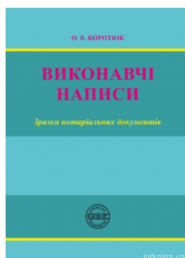
Виконавчі написи: зразки нотаріальних документів