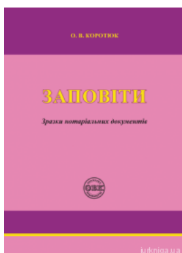
Заповіти: зразки нотаріальних документів