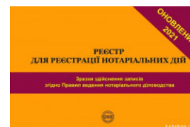
Реєстр для реєстрації нотаріальних дій. Зразки здійснення записів згідно Правил ведення нотаріального діловодства

Перейти до галузі права Нотаріальне право