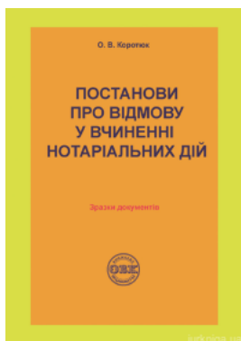
Постанови про відмову у вчиненні нотаріальних дій: зразки документів