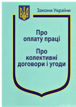
Закони України "Про оплату праці", "Про колективні договори і угоди"