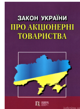
Закон України "Про акціонерні товариства". Алерта