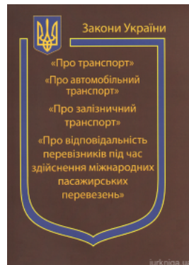
Закони України "Про Транспорт", "Про автомобільний транспорт", "Про залізничний транспорт", "Про..."