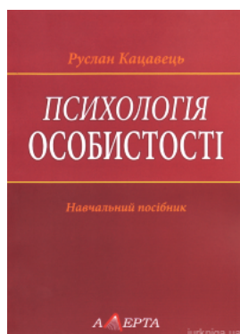
Психологія особистості. Навчальний посібник