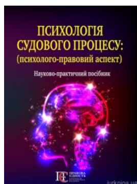
Психологія судового процесу (психолого-правовий аспект)