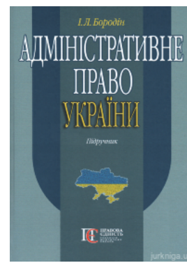
Адміністративне право України. Підручник