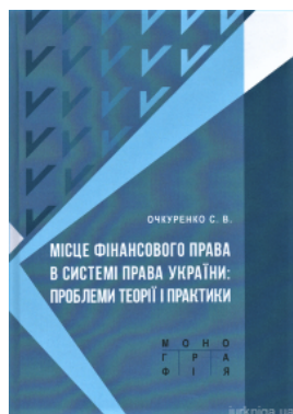
Місце фінансового права в системі права України: проблеми теорії і практики