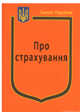
Закон України "Про страхування"