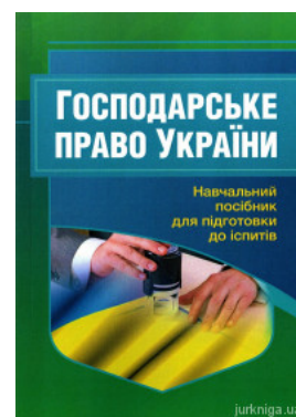
Господарське право України. Навчальний посібник для підготовки до іспитів