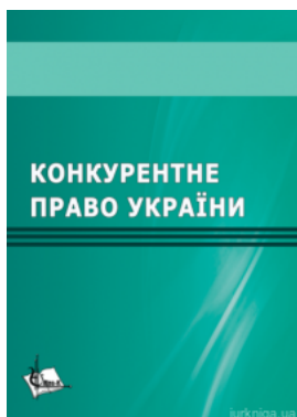
Конкурентне право України