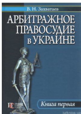
Арбитражное правосудие в Украине. Книга первая