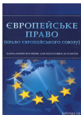
Європейське право (право Європейського Союзу). Навчальний посібник для підготовки до іспитів