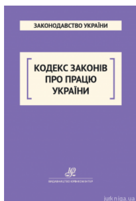
Кодекс законів про працю України. Юрінком Інтер