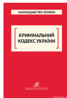
Кримінальний кодекс України. Юрінком Інтер