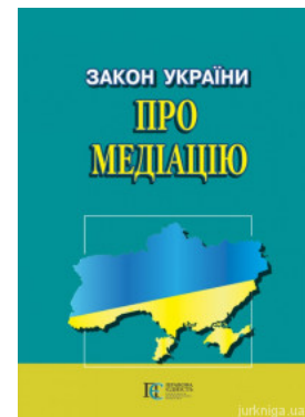
Закон України "Про медіацію"