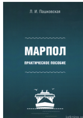
МАРПОЛ: практическое пособие