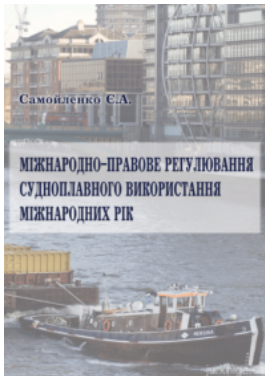
Міжнародно-правове регулювання судноплавного використання міжнародних рік