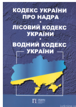
Кодекс України про надра. Лісовий кодекс України. Водний кодекс України. Алерта