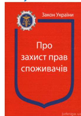
Закон України “Про захист прав споживачів”

Перейти до галузі права Господарське право та процес