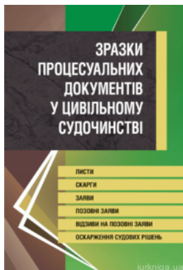
Зразки процесуальних документів у цивільному судочинстві. Листи, скарги, заяви, відзиви на позовні заяви, оскарження судових рішень.