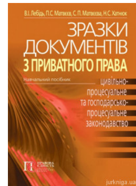
Зразки документів з приватного права (цивільне, сімейне, житлове, трудове, земельне, цивільно-процесуальне та госпо-дарсько--процесуальне...