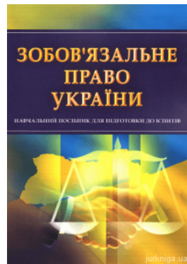
Зобов'язальне право України. Навчальний посібник для підготовки до іспитів