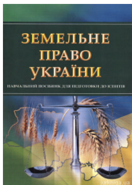
Земельне право України. Навчальний посібник для підготовки до іспитів