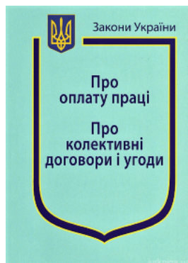
Закони України "Про оплату праці", "Про колективні договори і угоди"