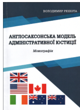
Англосаксонська модель адміністративної юстиції