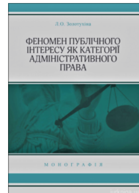
Феномен публічного інтересу як категорії адміністративного права