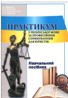
Практикум з української мови за професійним спрямуванням для юристів