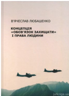
Концепція "Обов'язок захищати" і права людини