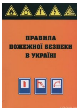
Правила пожежної безпеки в Україні