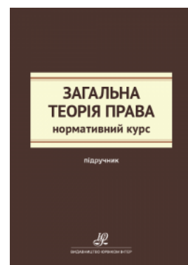
Загальна теорія права. Нормативний курс

Перейти до галузі права Кримінальне право та процес