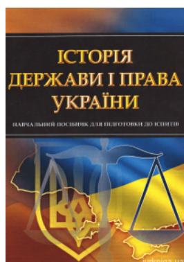
Історія держави і права України. Навчальний посібник для підготовки до іспитів