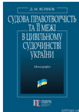
Судова правотворчість та її межі в цивільному судочинстві України