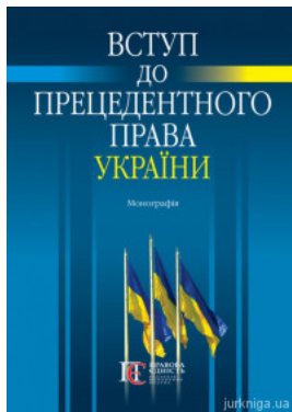
Вступ до прецедентного права України